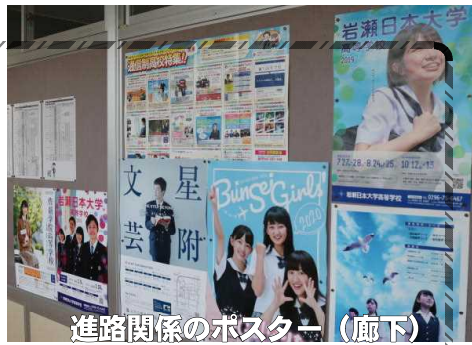
進路関係のポスター (廊下)

本年度も残すところ2か月…生徒たちは「ま・と・め」の学期として、1年間を振り返り、その成果と課題をもとに新年度に向けての準備に入っています。特に3年生は、いよいよ進路決定へ向けて大詰めを迎えています。体調を整え、より一層勉学に励んでほしいと思います。