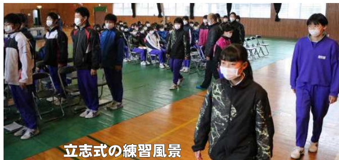
立志式の練習風景

立志式は、14歳(数えて15歳)の節目に当たり、次代を担う若者としての使命を自覚させ、高い理想をもって自分の未来を切り拓いていこうとする自主・自立の心を育てることを目的として実施するものです。将来に向かって志を立て、その志を達成するため自らが責任を自覚し努力していくこと…それはとりもなおさず、ご家族や先生方に教え導かれていた自分から、自分で考え自分で判断しなければならない機会が増え、その判断には責任が伴うことを意味しています。ぜひ意義のある立志式にしたいと考えておりますので、どうぞよろしくお願いたします。