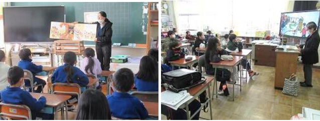
読み聞かせボランティア 11/24、12/1、12/15