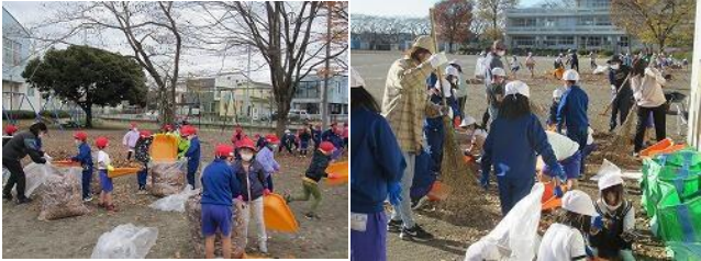
11/25・28 クリーン作戦(1・2・3・5年 落ち葉さらい)