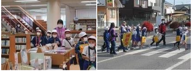
11/18 2年学区探検(市役所・市図書館他)