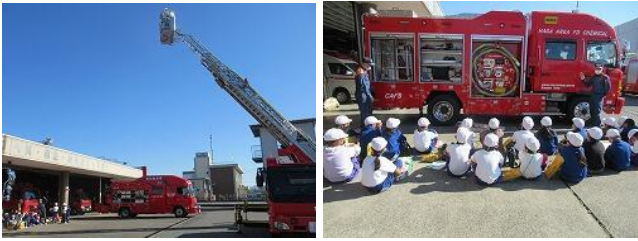
11/25 3年社会科見学(真岡消防署)