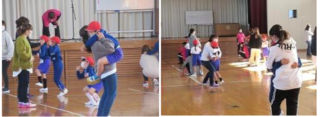
11/25 1年親子体育(家庭教育学級)