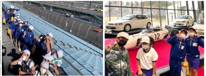
11/22 5年社会科見学(モリテリゾートもてぎ)