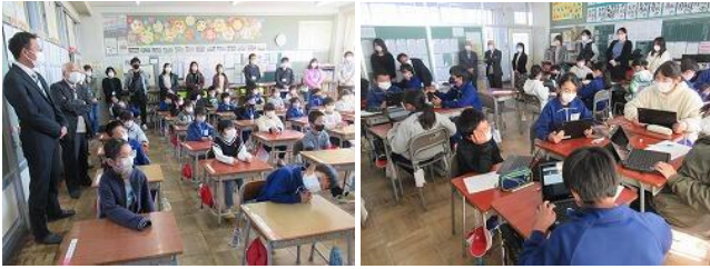
11/16 フリータイム授業参観・学校評議員会