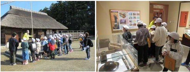
11/18 4年社会科見学(尊徳資料館他)