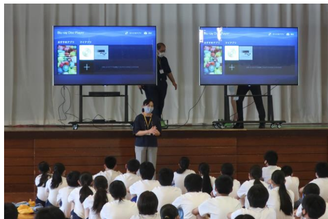
【修学旅行オリエンテーションの様子】

秋頃までにはコロナが収まり、当初の計画通りの教育活動ができることを願っている毎日です。