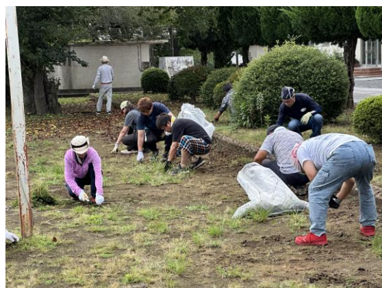
(ボランティアの皆様)

最後になりましたが、遅ればせながら、8月24日(水)に実施した学校緑化活動にご参加くださいました保護者、地域の皆様、本当にありがとうございました。きれいな環境の中でこそ生徒たちは伸び伸びと成長できます。生徒たちの育成には、保護者、地域の力は欠かせません。学校支援ボランティアの募集も随時行っておりますので、今後とも、よろしくご協力をお願いいたします。