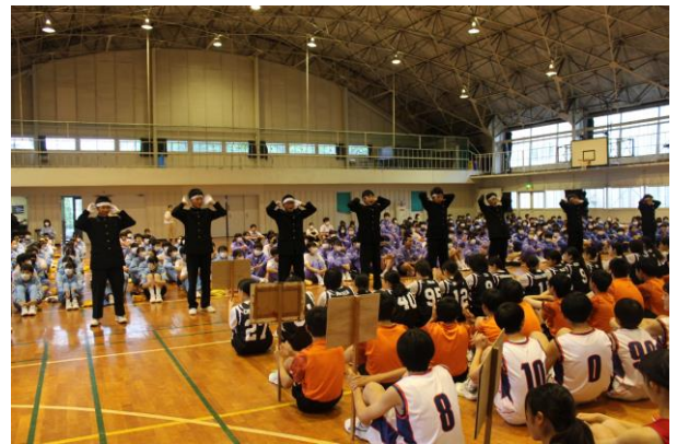
【選手壮行会の様子】

今年度から春季各種大会が廃止され、総合体育大会に一本化されたことに伴い、郡市総体も例年より早めの実施となりました。会期に余裕を持つことによる熱中症対策等が主な要因です。まだ月末に郡市陸上大会が控えておりますが、今年も多く部の活動が郡大会を勝ち抜き、県大会に出場することになりました。関東大会や全国大会を目指して頑張してほしいと思います。応援する中で全体的に技術の低下が見られると感じました。これは、コロナ禍での行動制限や部活動改革としてのガイドラインの徹底等によるものと思われませんが、ある意味当然のことです。中学校の部活動の目的は、勝つことのみを目指すのではなく、体力や技能の向上を図る以外に友人や先生との好ましい人間関係づくり、学習意欲の向上、自己肯定感、責任感、連帯感の涵養など、生徒の自主的な学びの場としての教育的意義があるからです。全体的に活動時間が短くなっているのが主な要因ですが、それをカバーするのが生徒の自主性や団結心など強い精神力、たくましい心です。今回、これに勝てば県大会出場、というしびれる試合を勝ち抜いた部がいくつかあります。この気持ちの強さは部活動だけでなく、日常生活の中で培われるものだと思います。子供たちにはつらいけど乗り越えられる適切な負荷を与えることが重要なんだと実感させられました。