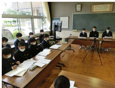
会議室にて 生徒会役員と各種委員会委員長

5月12日（水）に生徒総会が行われました。生徒会役員が中心となり、進行や活動方針等の説明を行いました。また、各委員会の活動予定は委員長がていねいに伝達しました。教室では、話に真剣に耳を傾けていました。