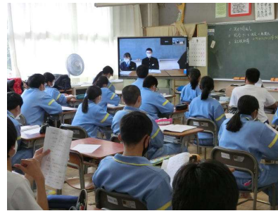
教室にて リモートで全校生が参加

今年度の生徒会は、「巻き起こせ！真中革命～燃やせ三種の神気～」というスローガンのもと、何事にも本気で元気に取り組む活気があふれる学校をつくっていきたくて考えています。その具体的な活動として、みんなでつくろう明るい未来プロジェクトやSchool warring activity、発散week、あいさつ強化週間などを実施していきたくて思います。