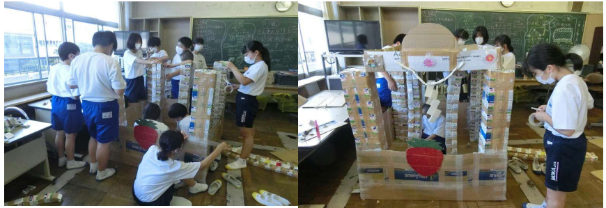
「山車の制作」の様子

2学期は反省点を改善していきたいです。そして、いろいろなことに積極的に取り組み、よりよいクラス、学年になるようにみんなが協力して頑張っていきたいと思います。