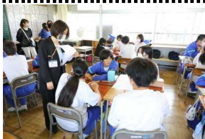
<授業参観 のようす>