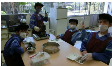
作業学習（コーヒー）