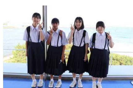
エネルギー教育校外学習の様子