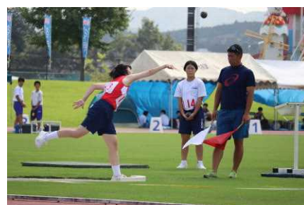
郡市新人陸上競技大会の様子