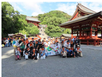
鶴岡八幡宮をバックに

1日目は、新江ノ島水族館見学後、班別自由行動を行いました。高德院や小町通りなどを散策し、鶴岡八幡宮に集合しました。2日目は、国会議事堂や東京タワー、がすてなーにを見学をしました。めあてでもある自分たちで考え行動する力を身に付けるとともに、友情を深めることができた修学旅行となりました。保護者の皆様には、早朝からのお見送りやお迎えなど大変お世話になりました。