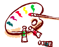
絵画作品 『校庭の風景』