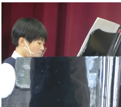
1年生らしい爽やかな合唱。 『敢闘賞』