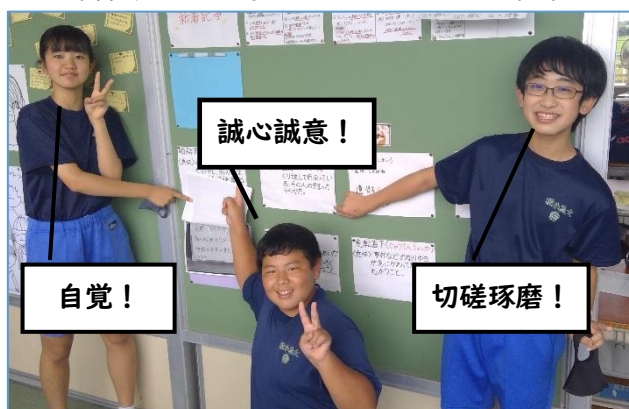
辞書係の3人選んだ、次に伝えたい言葉

この係は、1年生から継続しています。そのためか、係の生徒だけでなく、2年生全体に辞書を引く習慣が身に付いてきました。今後も精力的に活動していくと思います。