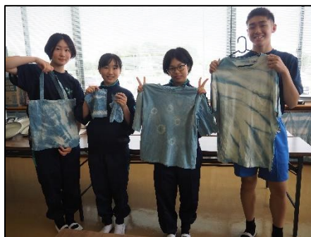
創作活動（藍染め体験）