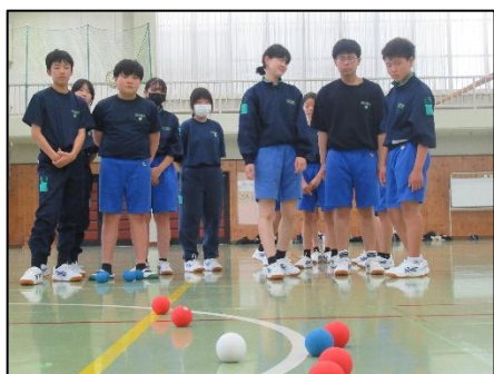
ニュースポーツ(ボッチャ体験)