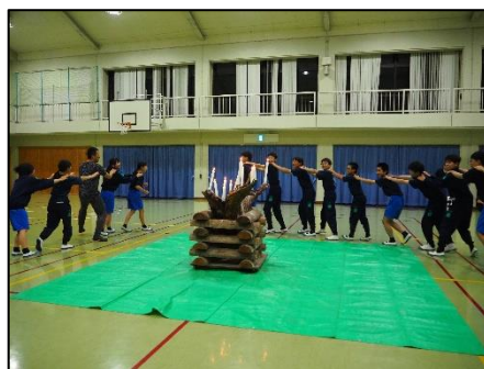
キャンドルファイヤー