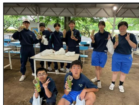
創作活動（竹スピーカー作り）