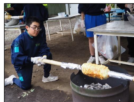
ふれあい活動（パークマン作り）