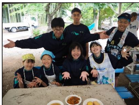
カレーコンテスト

5月27日（月）～29日（水）にかけて、自然教室がありました。2年生にとっては最後の自然教室となりましたが、学年を越えてお互いに協力しながら意欲的に活動に取り組みました。カレーを作ったり、ニュースポーツを行ったり、キャンドルファイヤーでフォークダンスを踊ったりと充実した3日間となりました。保護者の皆さまには、準備等ご協力いただき、大変世話になりました。