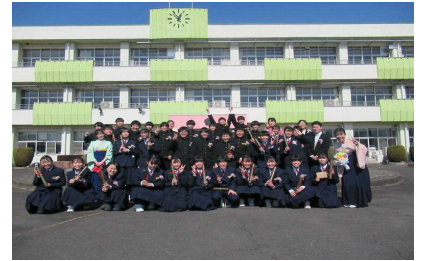
【校舎前で最後の学級写真】