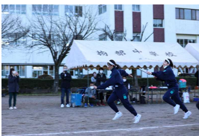
全員リレー・バトンパス