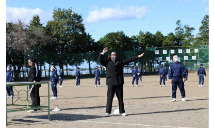
白組団長のエール