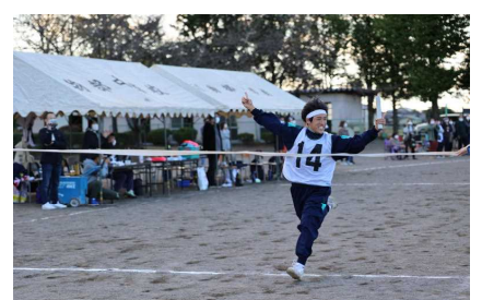
全員リレーゴール！！