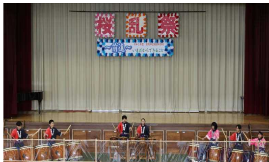
尊徳太鼓保存会の生徒たち