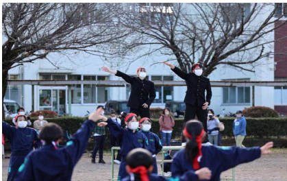
赤組団長のエール