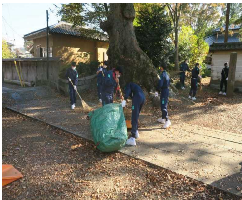
高田山専修寺にて

11月4日（木）に桜町陣屋跡周辺と高田山専修寺の2か所に分かれ、「クリーン・アップものべ2021」を実施いたしました。本来、小学校と合同の活動ですが、新型コロナウイルス感染症対策のため、中学校だけでの実施としました。地域の一員としての自覚を高め、地域に貢献しようとする態度を育てるための活動です。