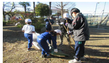
小中連携事業として、桜町陣屋跡・二宮神社・物部小学校等の清掃活動を行いました。