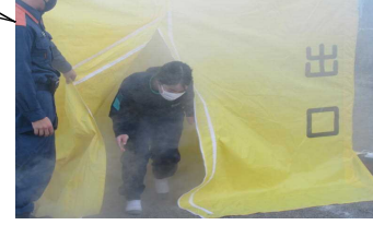
全生徒で煙体験を実施！