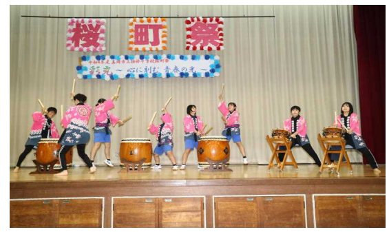
尊徳太鼓保存会(現役生徒と卒業生)

第1部の、合唱コンクールでは学級が一つとなり、体育館いっぱいに歌声が響きわたりました。また、特設合唱部の発表、英語スピーチ、少年の主張発表、吹奏楽部の演奏、尊徳太鼓保存会による尊徳太鼓が披露されました。第2部では、個人発表で6グループがダンスやコント等を披露したり、生徒会の部では、生徒全員で「○×クイズ」、「なぞなぞ」を行い会場を盛り上げてくれました。今回の桜町祭は、実行委員会を中心に、生徒たちが何度も議論をし、スローガン『彩光』～心に刻む青春の光～の実現に向け、主体的に活動することで、互いに学びあい、喜びあい、励ましあって責任と協力の態度が身に付けた行事となりました。(その他の活動は裏面)