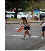
特設駅伝部の生徒たち 「みんなでつないだ礫！」