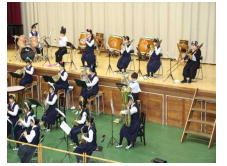
特設合唱部の発表「海の不思議」 吹奏楽部の演奏「スターライト・ウィンク 他2曲」