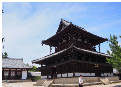
金堂（法隆寺のご本尊を安置している）