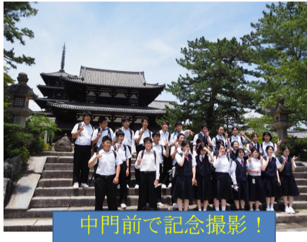
中門前で記念撮影！