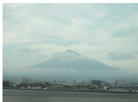
帰京 新幹線から見た富士山！