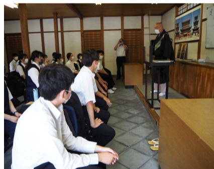
薬師寺にてお坊さんの説法を聞く！