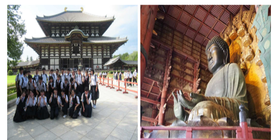
大仏殿前記念撮影