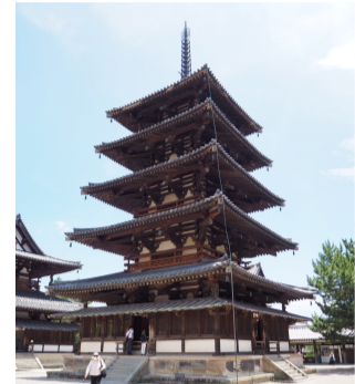
わが国最古の五重塔