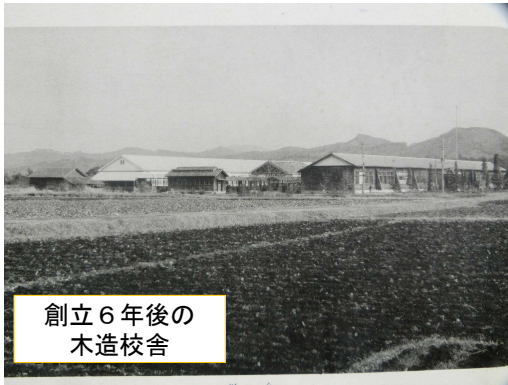
創立6年後の 木造校舎