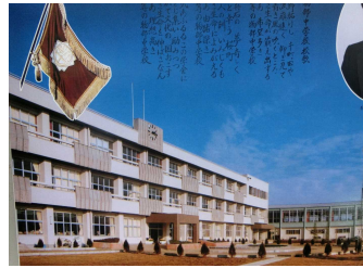
左右対称のシンメトリ構造