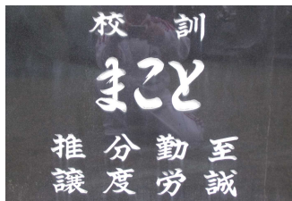
37周年の開校記念日に制定