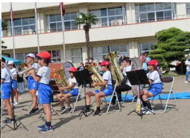
【久しぶりに実施できた金管バンド部の校歌演奏】