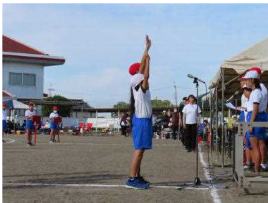
【気合いのこもった選手宣誓】

そして運動会当日。今年の運動会も、6年生を中心に係活動、開閉会式など大変よく頑張りました。演技・競技いずれも全力で取り組み、一致団結して頑張れた運動会で、「元気いっぱい 笑顔いっぱい みんなで伸びる学校」を感じた一日でした。子供たちに拍手です。保護者の皆様、準備・運営・片付けの御協力、また、最後まで応援、ありがとうございました。