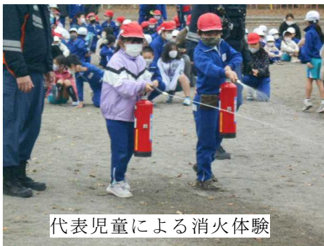
代表児童による消火体験