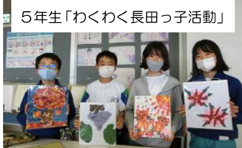
5年生「わくわく長田っ子活動」