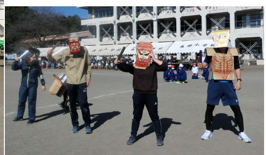
先生方「進撃の巨人」のつもり

ケーブルテレビ「いちごチャンネル」での運動会の放送日は12/10(金)8:00～と12/12(日)15:00～になります。