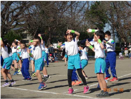
1・2年ダンス「Take a picture please!」

日頃の練習の成果を発揮し、自分のめあてに向かって全力を出して活躍しました。新型コロナウイルス感染対策の中、御声援・御協力ありがとうございました。