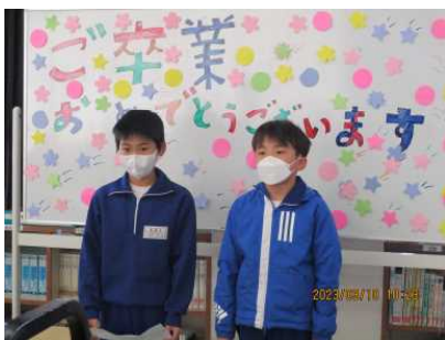
実行委員(5年)からのあいさつ