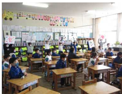
1年生からのメッセージ