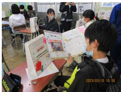
色紙の言葉を読む6年生