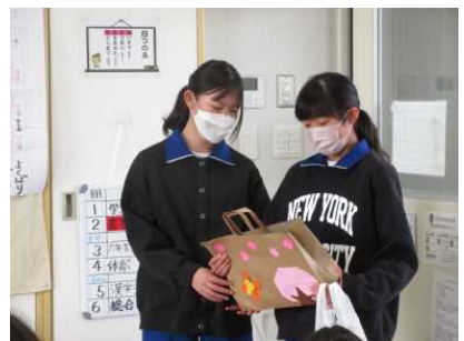
6年生からのプレゼント贈呈