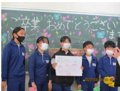
5年生からのメッセージ