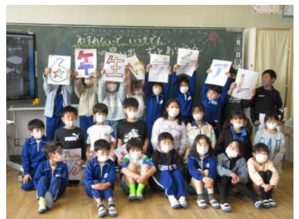
2年生からのメッセージ