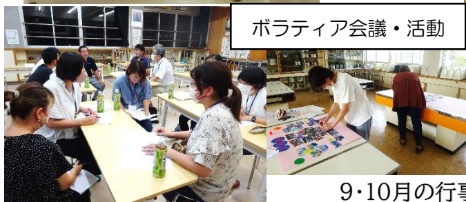
ボランティア会議・活動