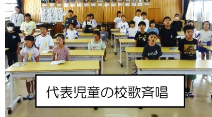
代表児童の校歌斉唱