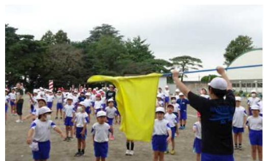
【運動会の練習風景】

さて、運動会の表現運動では、参観してくださる方に最高の演技を見せようと、一生懸命練習する姿が見られました。その姿は、多くの人に感動を与えます。このように、他喜力を意識し「みんなが嬉しい。だから自分も嬉しい」体験を繰り返すことで、自己肯定感を育み、より充実した学校生活が送れるよう支援したいと考えます。