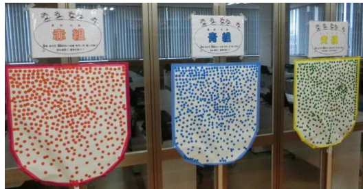
【読書玉入れ 得点表】

言葉を学び語彙が増える、知識が増える、想像したり共感したりすることで感性が磨かれるなど、読書をすることで生きる力も育まれていきます。私は、小学校の担任の先生から、「テーマを決めていろいろな作者の本を読んでごらん」と教えていただいたのを今でも覚えています。そして、「妖精が主人公の本」を探して読んでいた時、「だれも知らない小さな国」シリーズに出会いました。何度も何度も繰り返し読み、大人になっても心に残る大好きな本となりました。児童にも、そんな本との出会いがあることを願っています。ご家庭でも、保護者の方が小学校の時に好きだった本を紹介したり、読み聞かせをしたり（お子さんに）してもらったりなど、いろいろな方法で読書の魅力を伝えていきましょう。