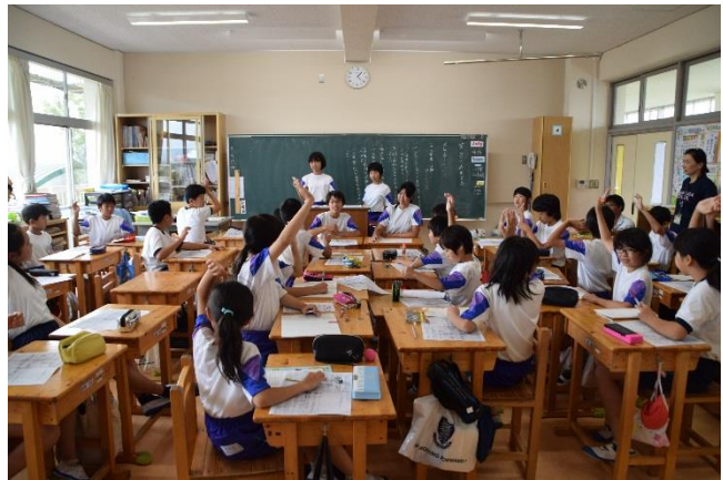
代表委員会での話合いの様子

そして、三つの学校を一つにしてくれたのが、65名の6年生です。6年生は最上級生として大活躍してくれています。自分たちのことだけを考えるのではなく、下級生のこと、学校のことを考えて行動しています。例えばあいさつ運動、委員会活動などがそうです。児童会の企画委員会・代表委員会で子どもたちの挨拶の声が小さいという実態を確認し、そのための対策を話し合いました。その結果、6年生全員で行う「月朝団」という名前のあいさつ運動や、代表委員会による毎朝のあいさつ運動を、昨年に引き続き実施し、全校児童が元気に挨拶できるようになりつつあります。これは子どもたちの自分たちで考えて実行した自治的な活動です。このような活動が子どもたちが安心して過ごせる学校を作っており、統合してみんなが一つになったなと感じています。