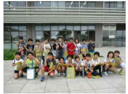
6/21 3年生・社会科見学