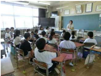
7/4 4年生・読み聞かせ