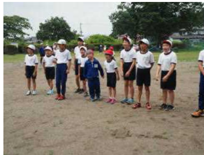
プールサイド除草