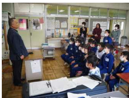
☆さいこうクラブの方による よみきかせ