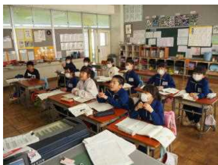
☆みんな集中して、授業に取り組んでいます。