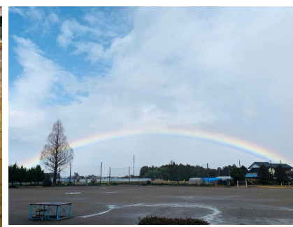
☆きれいな虹が見られました。