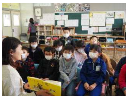
☆図書館司書による よみきかせ