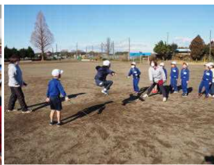
☆ただいまの記録、153回！