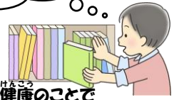
□体や健康のことで 知りたいことがあるとき