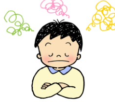
□心や体のことで こまっていることがあるとき