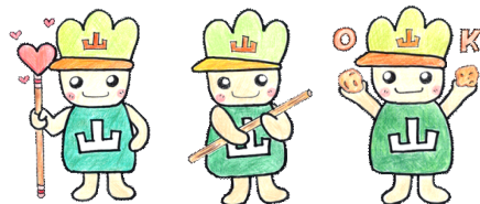
おもいやり しんぼう がじゃいも

さて、1月は「往ぬる」、2月は「逃げる」、3月は「去る」とも言われるように、忙しい毎日が続きます。短い学期ではありますが、学習のまとめをしっかりと行い、体力・気力ともに充実するよう支援していきます。本年もどうぞよろしくお願い致します。