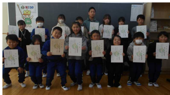
3学期学級委員の児童