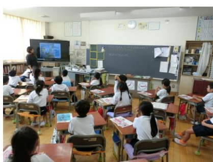
動画を視聴してポイントを確認