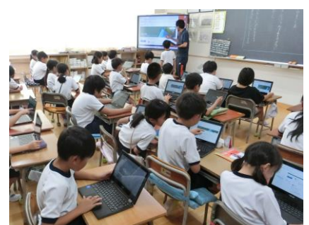
タブレットを使用した振り返り