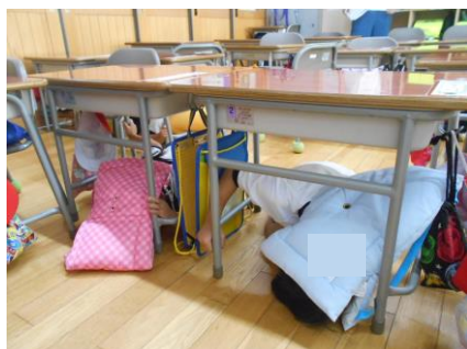
防災頭巾をかぶって机の下に

今月3日(水)には突風や大雨により本地区でも倒木などの被害が見られましたが、本校では校庭南の桜の木が根元から倒壊したため、撤去しました。