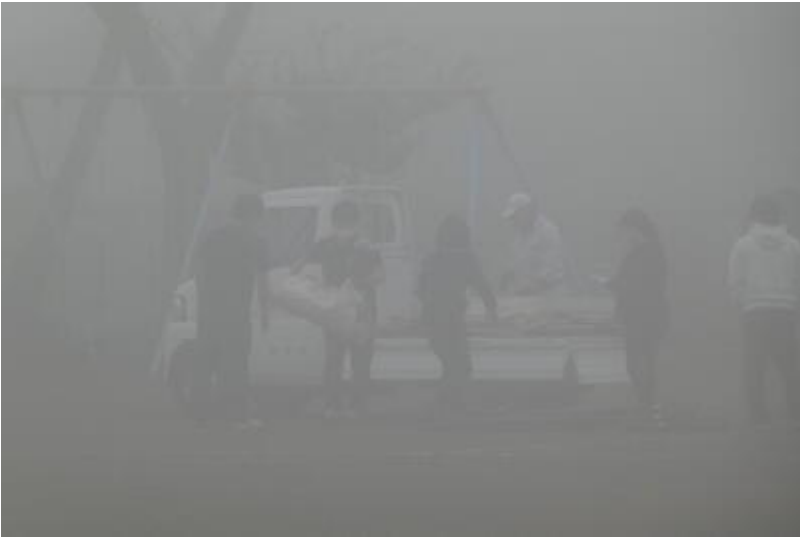
昼休みに6年生がそれを建てました。