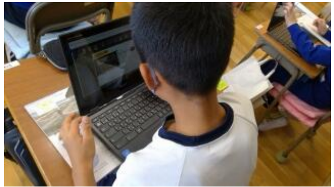
( ↓ 発表の様子 )