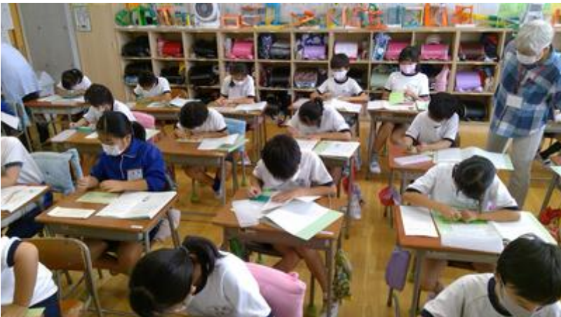
1時間集中して、手紙を仕上げました！