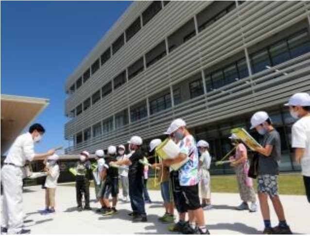
みんな、しっかりメモを取っていますね。