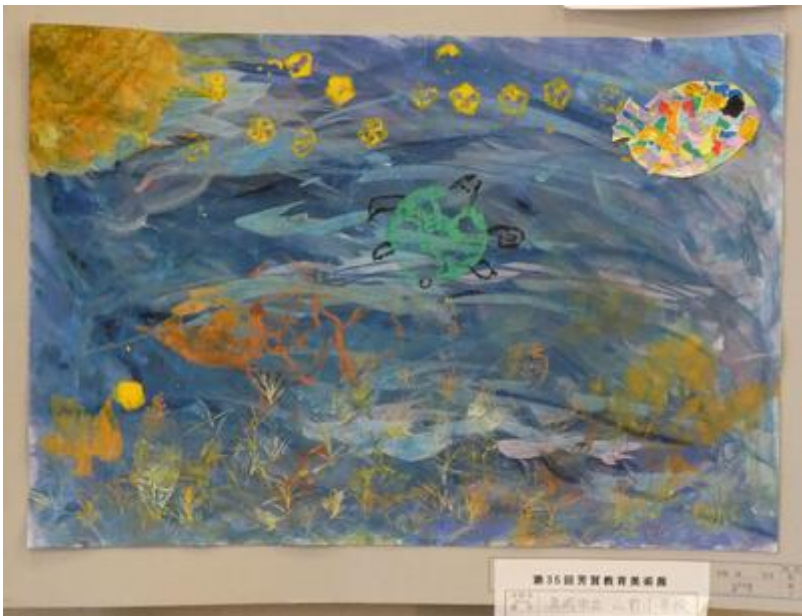
↓ 3学年児「楽しい花火大会」