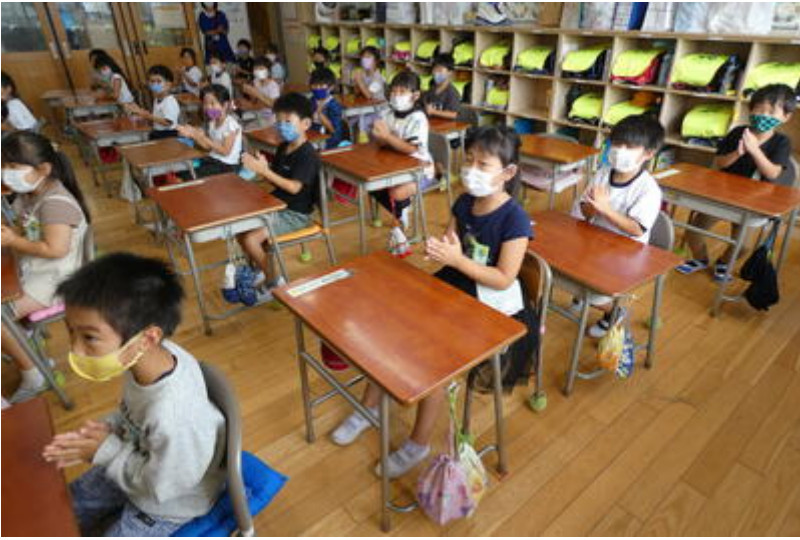
後半はビンゴゲームをしました。