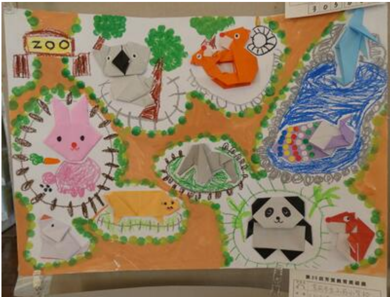
↓ 3学年児「カラフルな海」