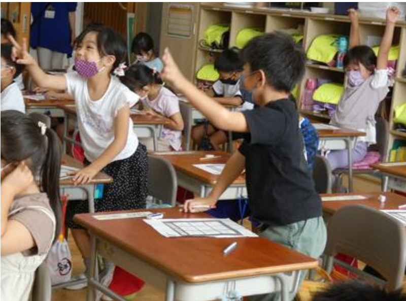
ご褒美のシールをいただきました。