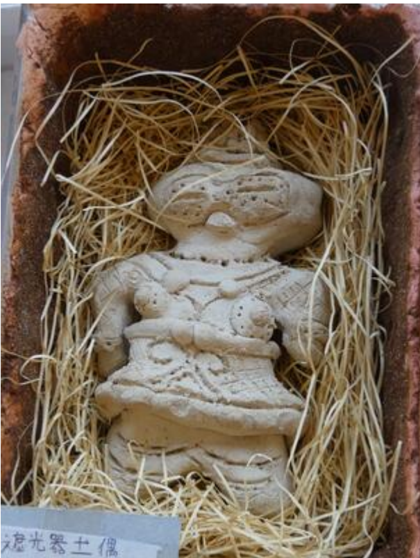
↓ 5学年児「みんなで花火見たいな」