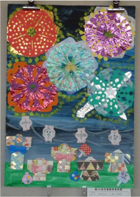
↓ 4学年児「遮光器土偶」