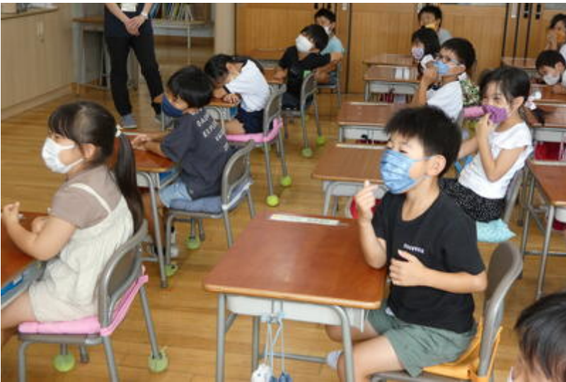
「いくつですか？」の表現も学びました。