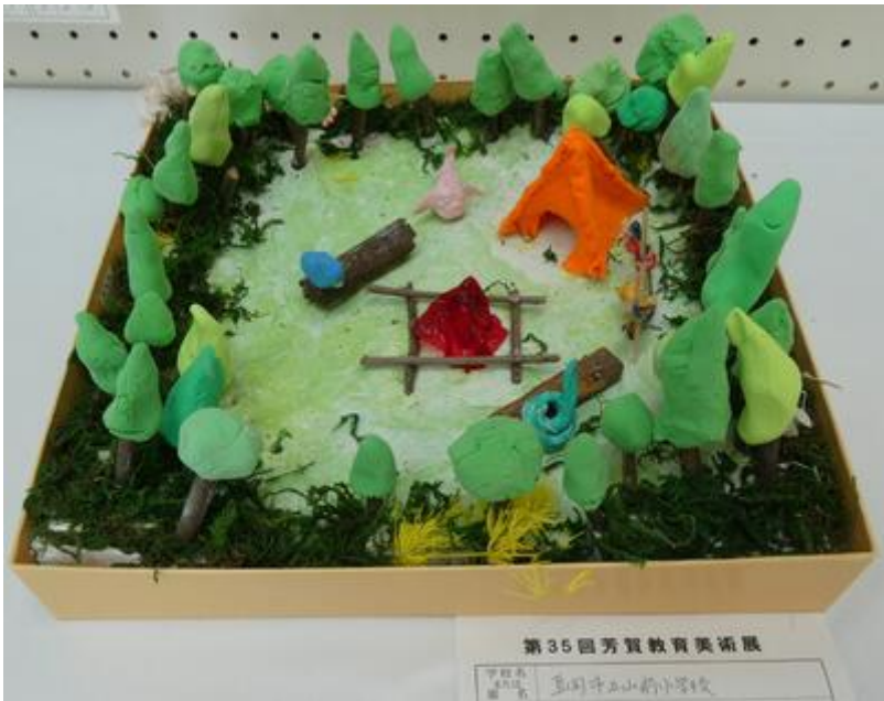
↓ 芸術協会長賞 4学年児「じんべいザメとダイバー」