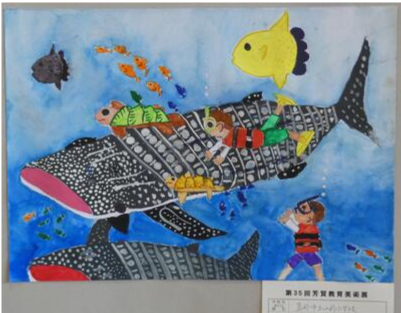
↓ 芸術祭賞 1学年児「ぼくがとったむしたち」