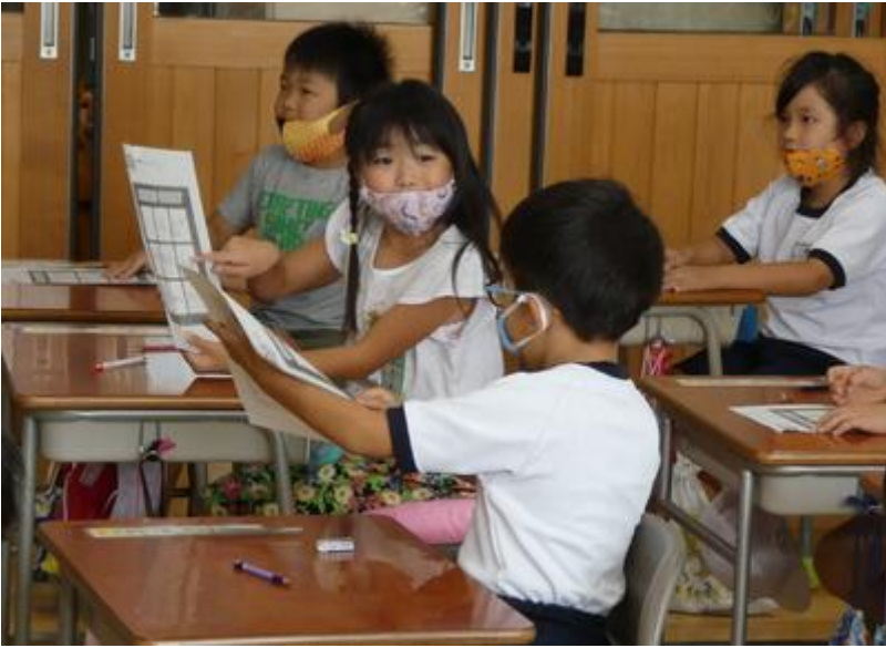
「リーチ!」「ダブルビンゴ!!」と大興奮。