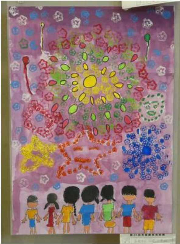
↓ 6学年児「教室の窓から」