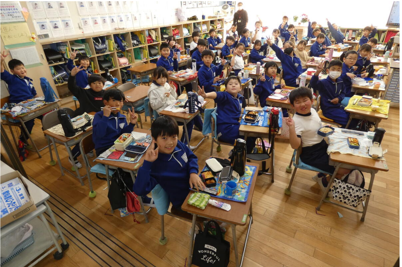
お隣、2年生教室です。