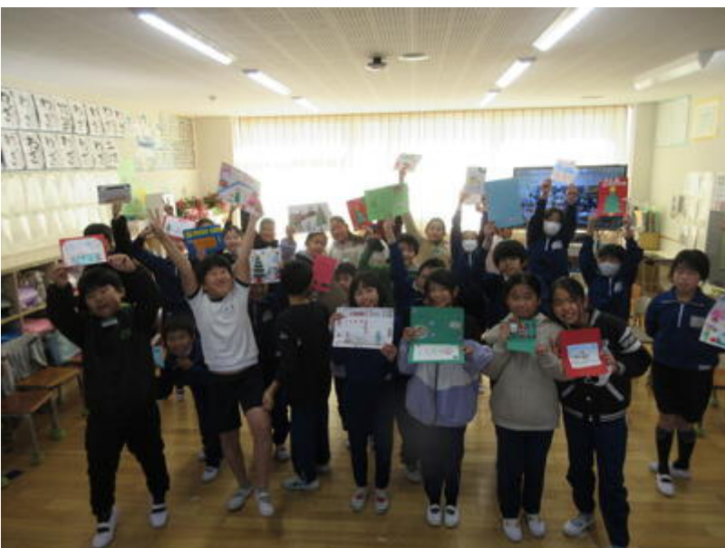
みんなで交換したクリスマスカードを持って、ハイ、チ～ズ☆シ