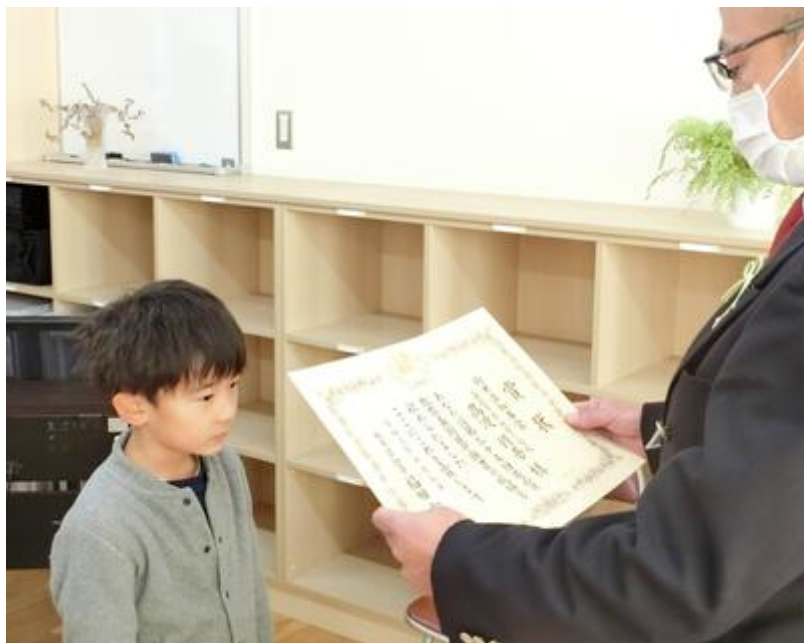
芳賀教育美術展 知事賞 (福田富一県知事からの賞状です!)