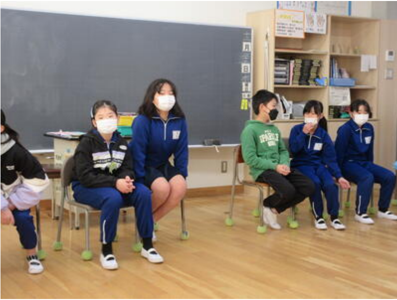
フルーツバスケットの様子です！担任が遊ぶのに夢中で、1枚しか撮れませんでした、、、。