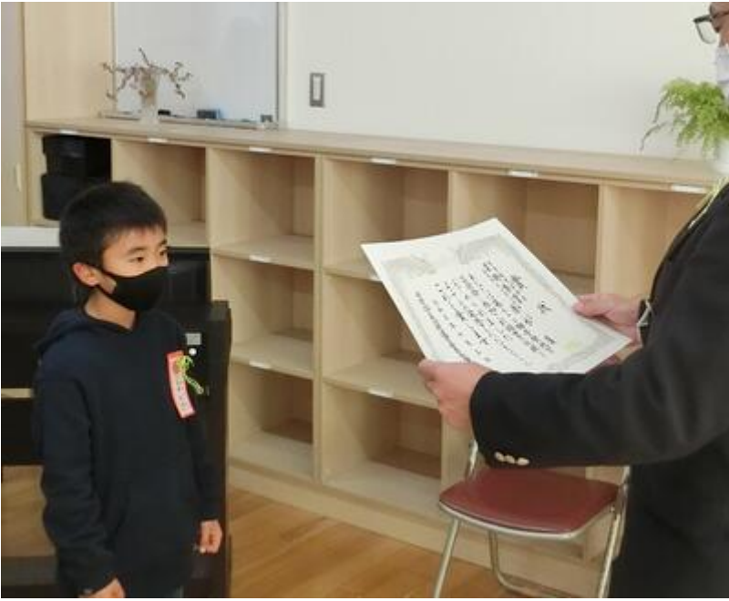
栃木県小学生バレーボール選手権大会真岡地区大会 優勝 山前南バレーボールクラブ