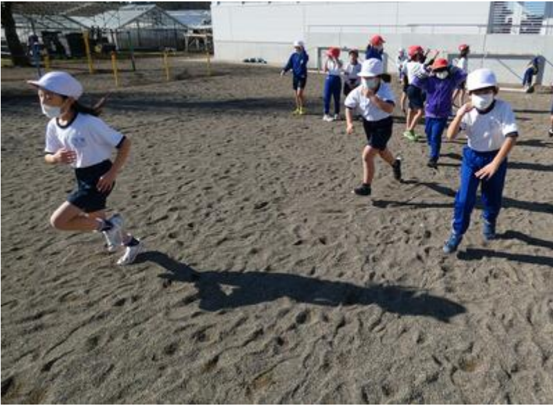
気合いいっぱいのケーサツ隊。