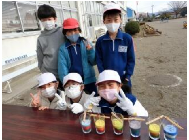
途中、室外機で冷ましている人も...(*'艸) 早く固まったかな？