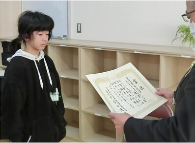
芳賀教育美術展 芸術協会長賞