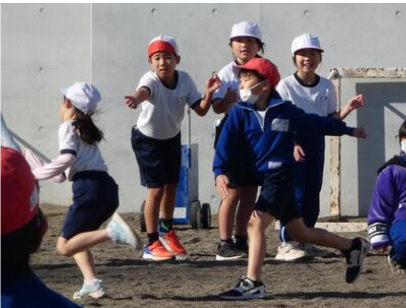
冷たい風もなんのその2年生でした。