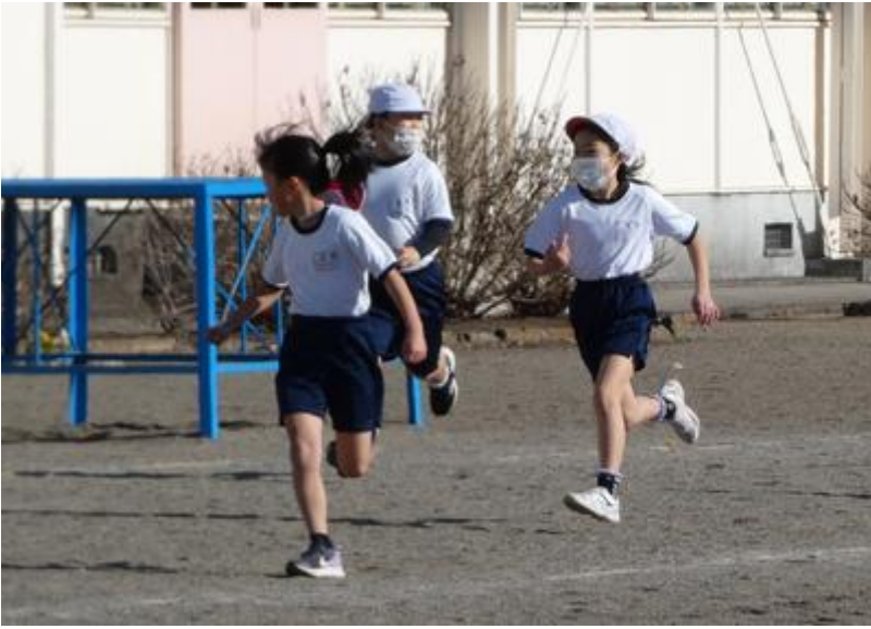
牢屋の中。捕まっちゃったドロボーたち。