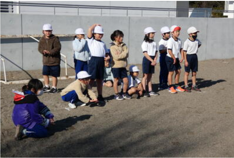
そこへ仲間のドロボーが助けに！・・・果たして牢屋から逃げる事ができたのでしょうか？