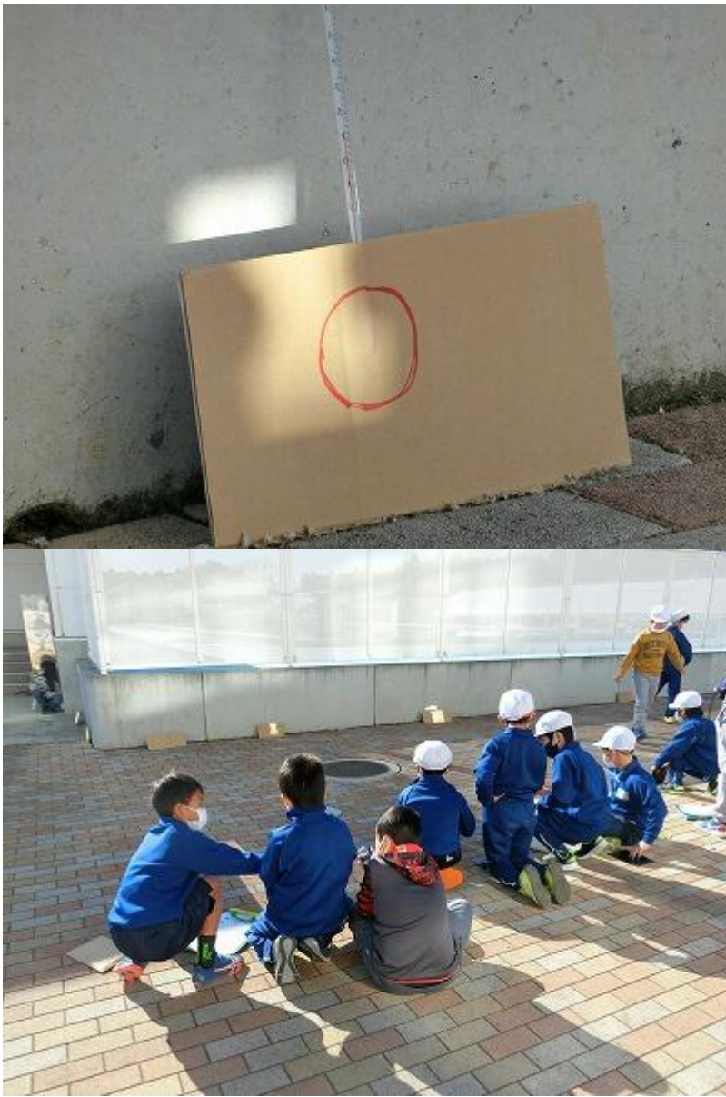
まずは、鏡1枚で実験。