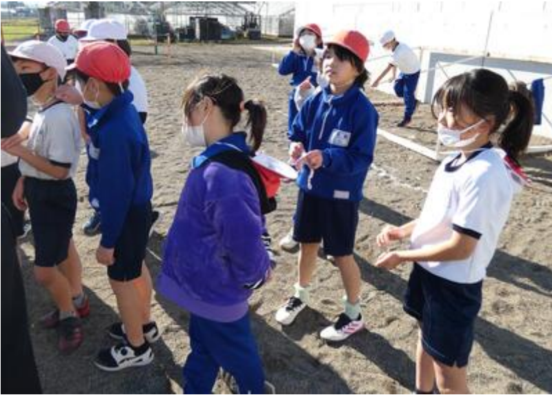
ケーサツ隊のミーティング。