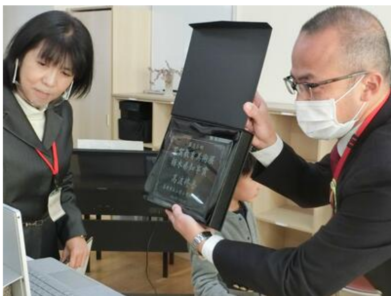
芳賀教育美術展 運営委員長賞