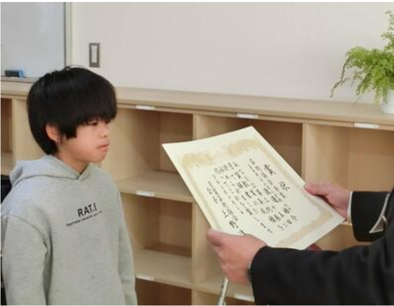
芳賀教育美術展 芸術祭賞