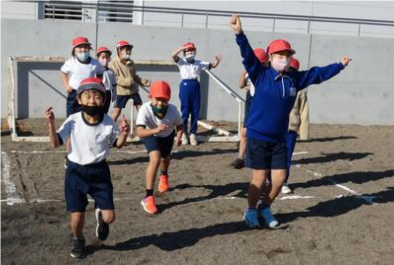
雄たけびをあげてドロボーを追っています。