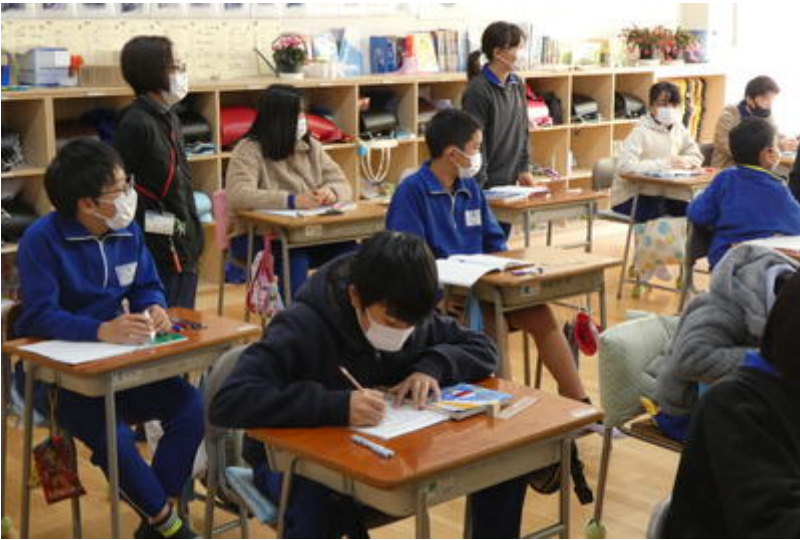
「木を見上げている角度」はこんな感じかな？とイメージしている子供たち。