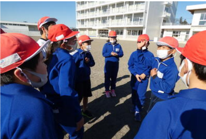
既に決まっちゃった白チームは、ノリノリです。