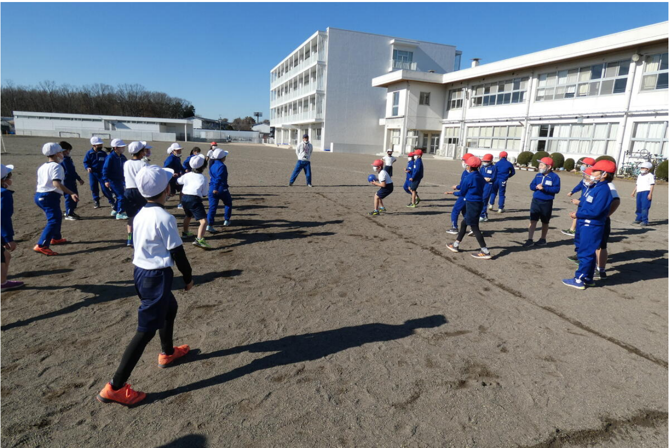
赤チームの綿密なミーティング。「王様」と外野選手を決めているようです。