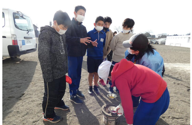
休み時間に他学年の子が見に来てくれました (^ ^ ♡