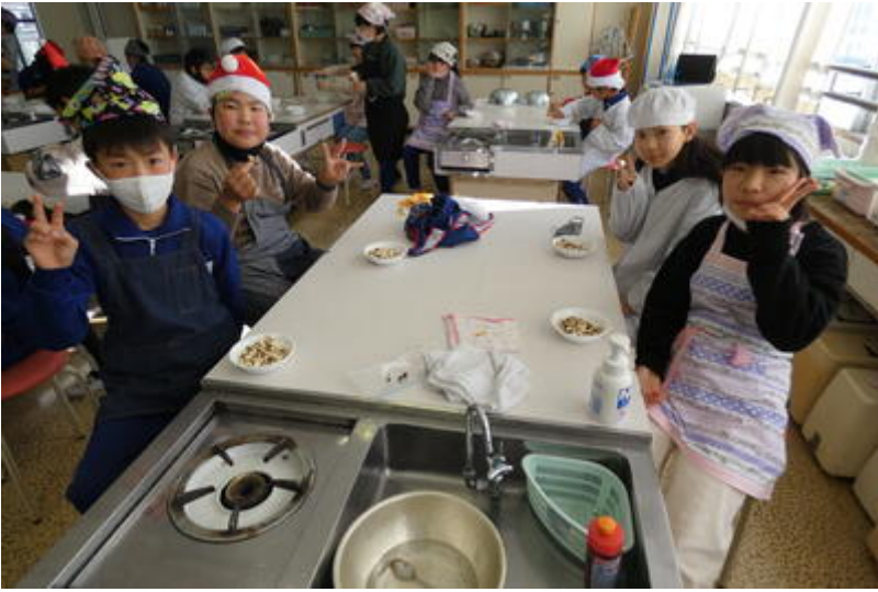
ミッキーもいました。