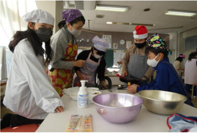
試食タイム。お焦げもあるけど、みんなで作れば、それは美味。