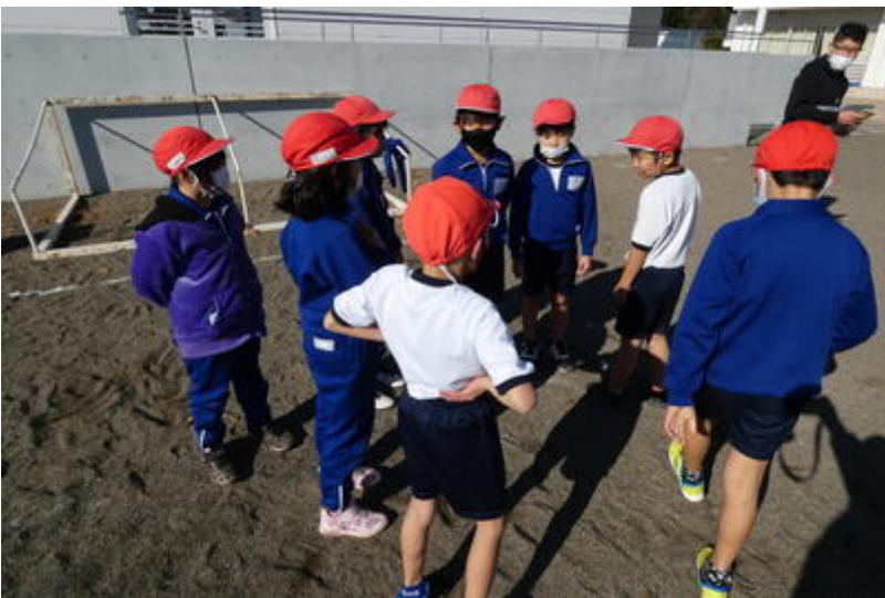
ドロボーは、ひと足先に逃げます。