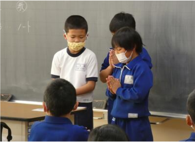
3年生の皆さん、ハイ、チーズ！