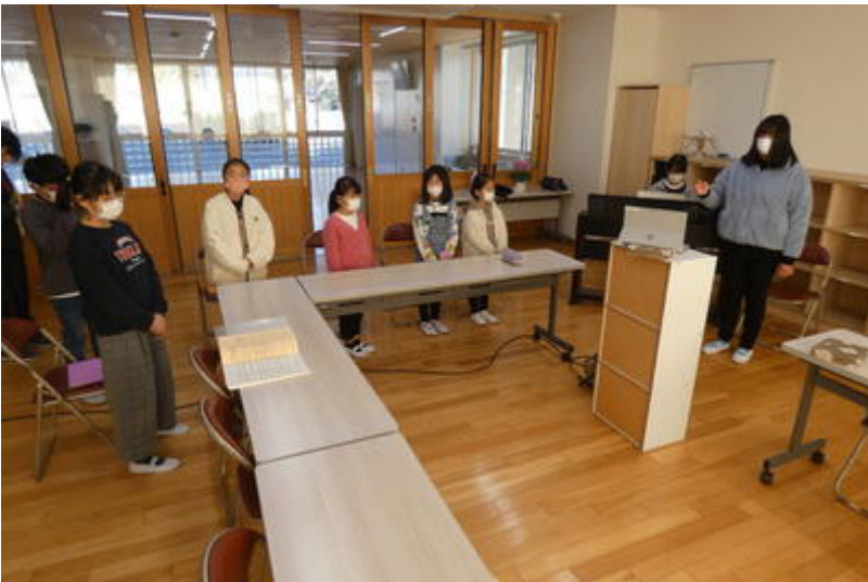
すばらしい演奏ありがとう。