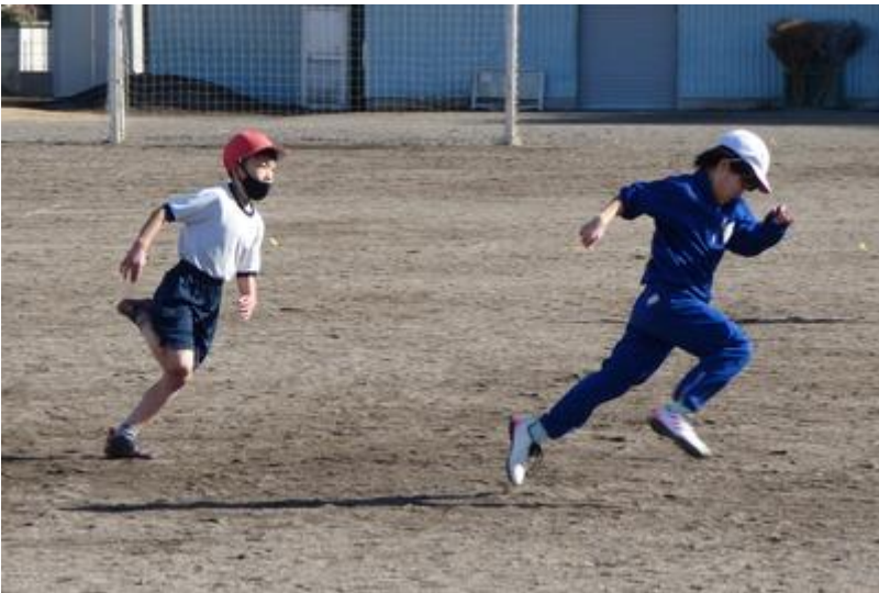
この走りに、体力づくりの成果が現れています。