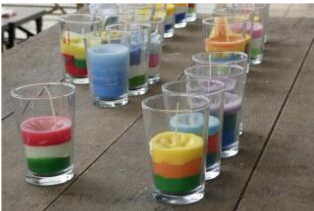
素敵な色に仕上がりました♪