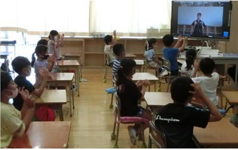
帰りの会の後、地震発生を想定した避難訓練と児童の引き渡し訓練を行いました。