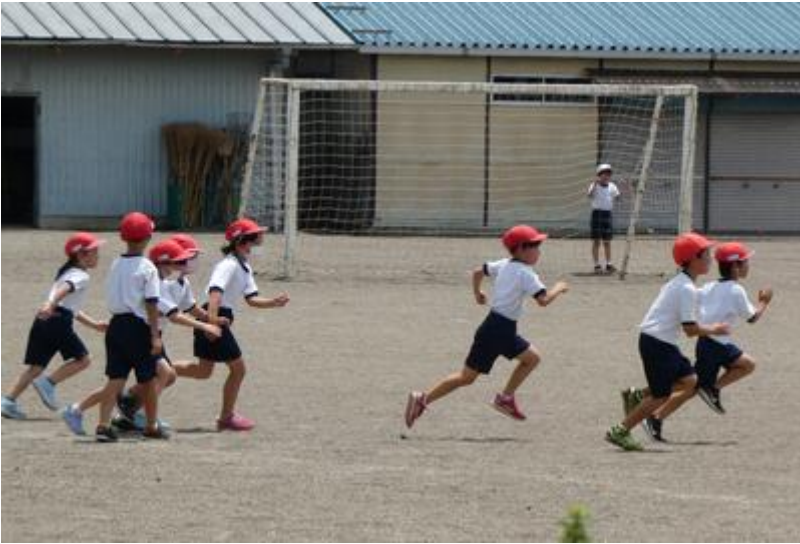
校庭は戦場と化しています。