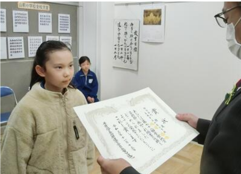
下野教育書道展 毛筆の部 銀賞