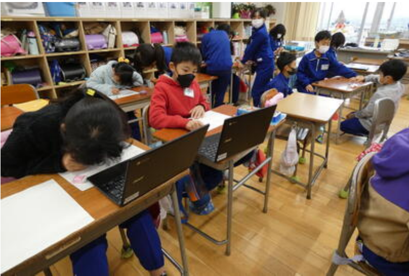
こちら3年生教室です。