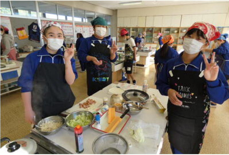
この班は、片付けをしながら調理を進めていたので褒めてもらっていました。