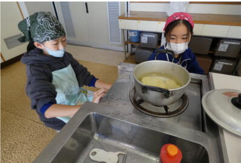
この班は豆腐と野菜のチャンプルーを作っています。