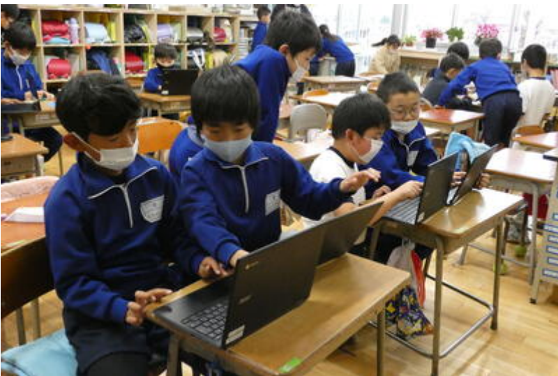
水色の円と白の円をうまく重ねて、ドラえものの顔を描いていました。