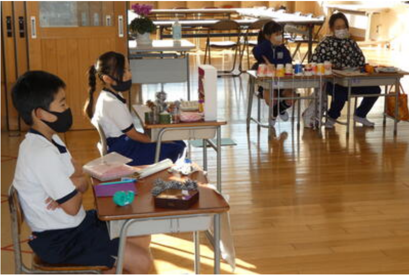
交流の始まりです。