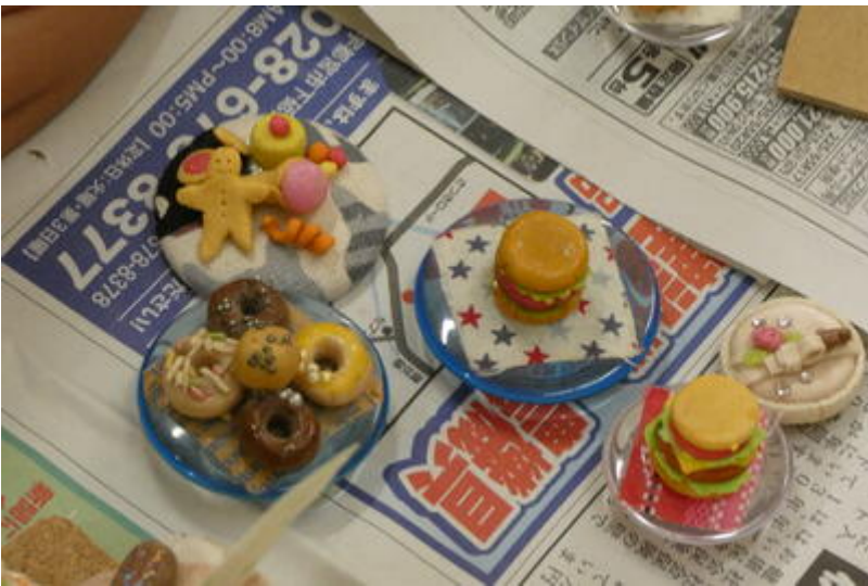
こちらは、お隣「瓶の小物入れ」作りの皆さんです。