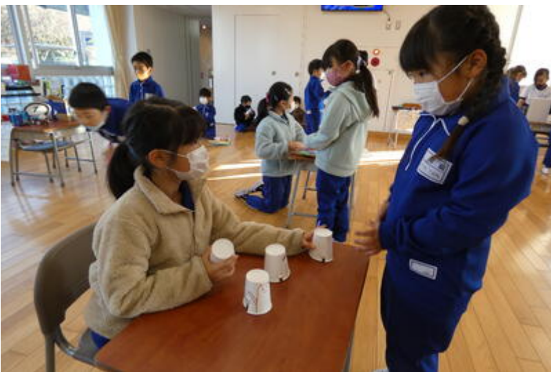
移動釣り堀です。向こうのお兄さんは、ジンベイザメが釣れたようです！