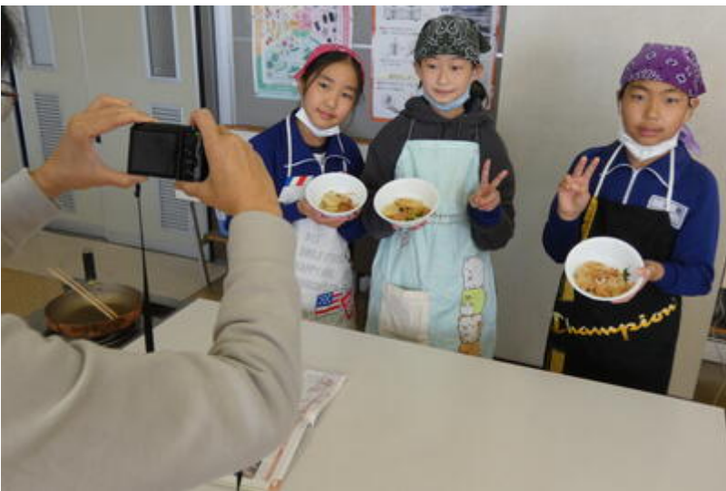
この班は、ベーコンポテトです。