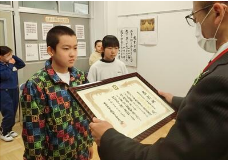
芳賀地方芸術祭 俳句部門 特選