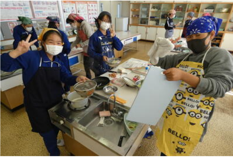
この班は、野菜のベーコン巻きを作っていました。