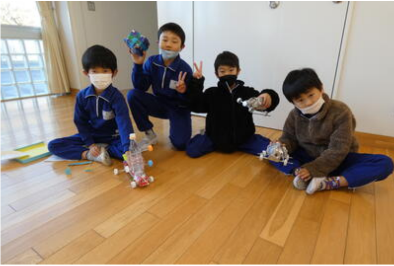
教室に戻った1年生は大喜び。