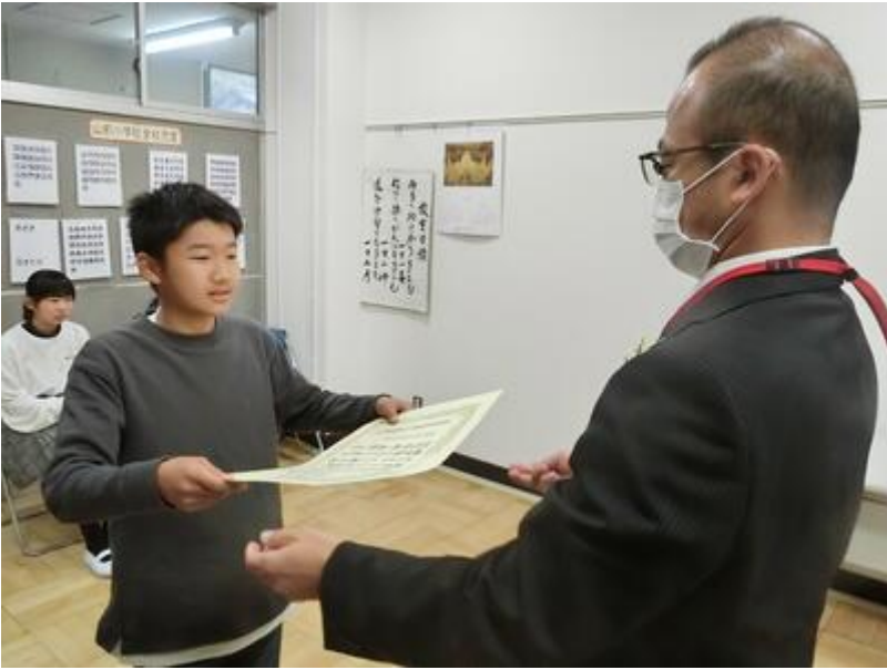
真岡市教育祭 表彰