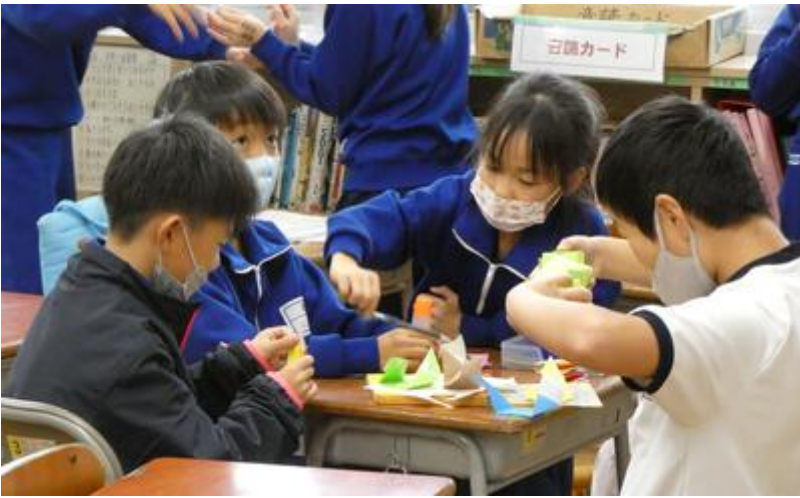
担任の先生と何を話しているのでしょうか。