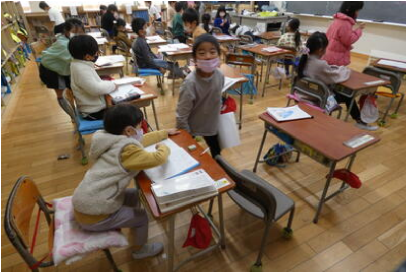
タブレット端末を通して、ノートを電子黒板に映しているところです。