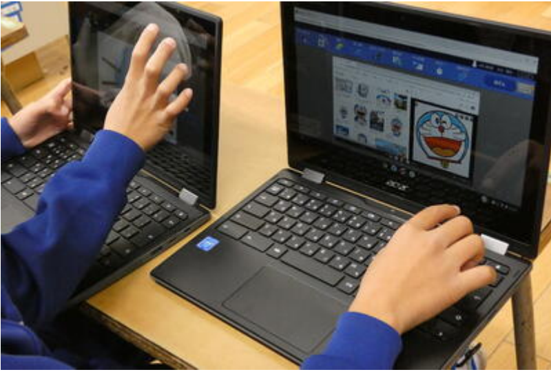
こちらは何やら折り紙ミーティング。