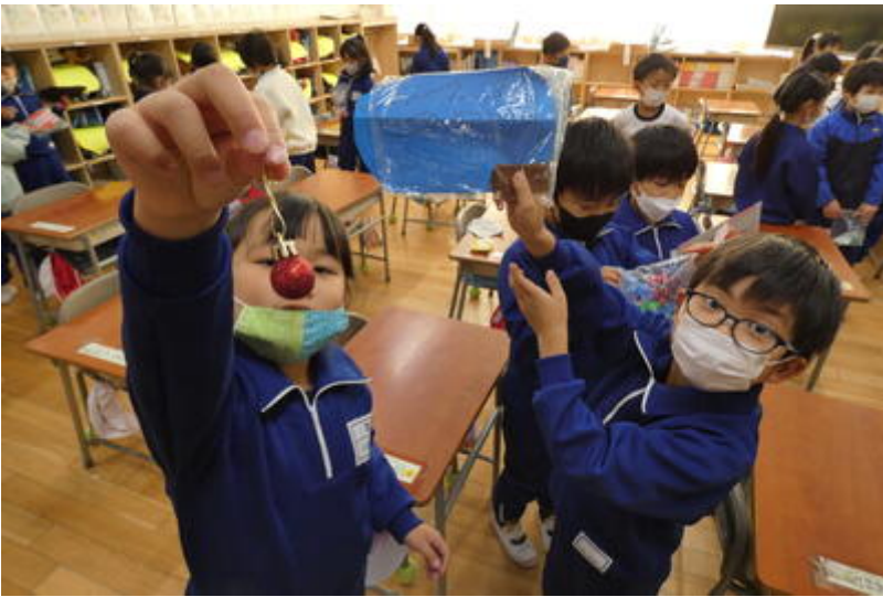
お土産や賞品をたくさんもらったね。