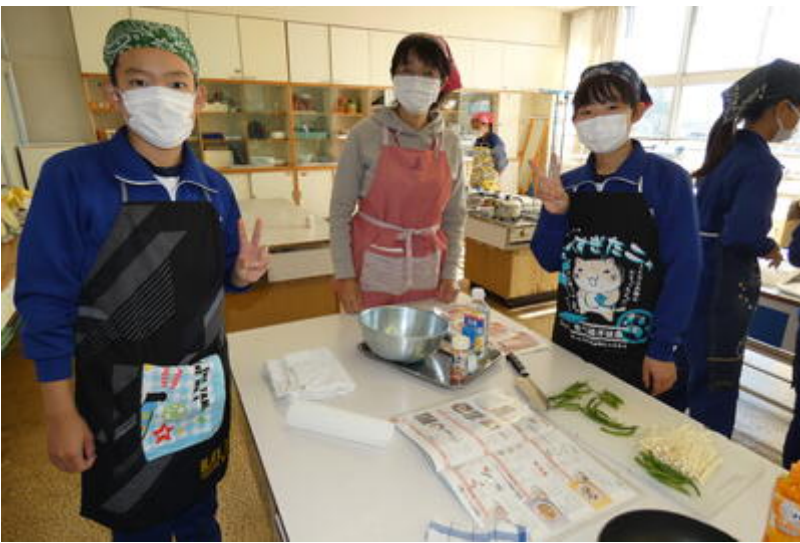
この班も、ベーコン巻きを作っていました。人参といんげんの火の通り具合に気を付けて茹でていました。