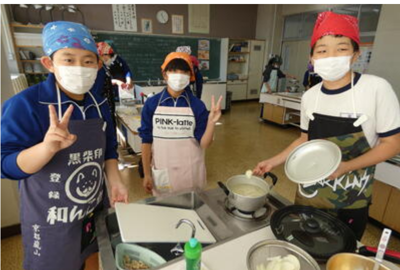
この班もチャンプルー隊です。残ったお豆腐は、冷奴にするとか・・・。