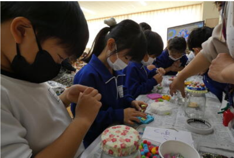
最後に、4階「クリスマスリース」作りの皆さんです。