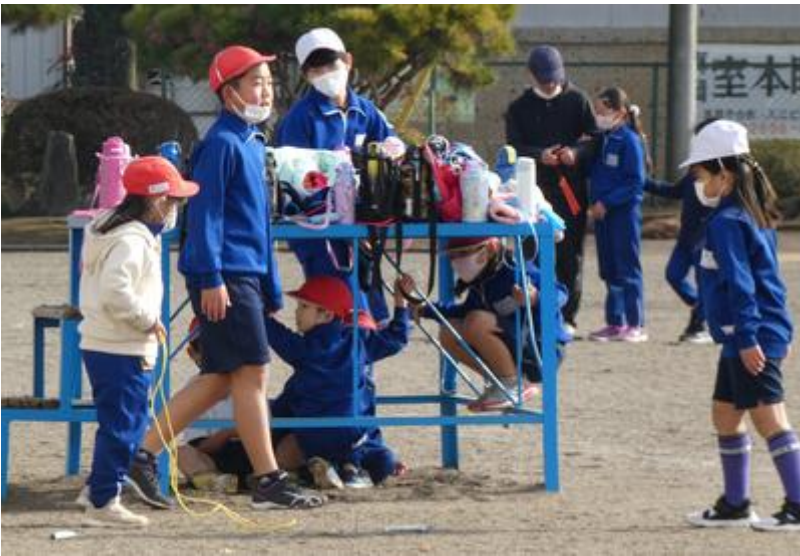
4年生は先生も交じって鉄棒ミーティング。