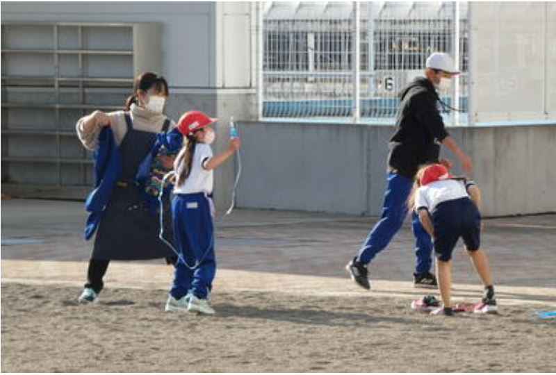
なかなか長く跳んでいます。スゴイ！