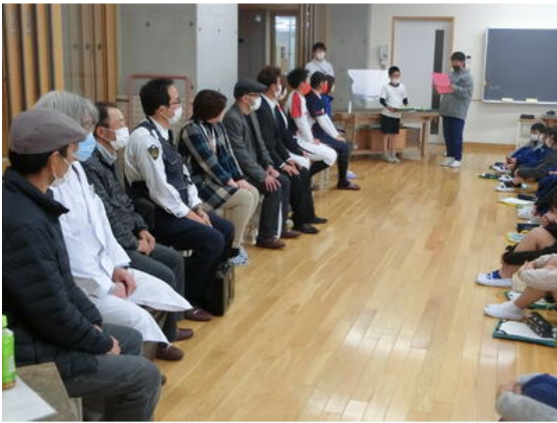
会に先立ち、自己紹介をしていただきました。