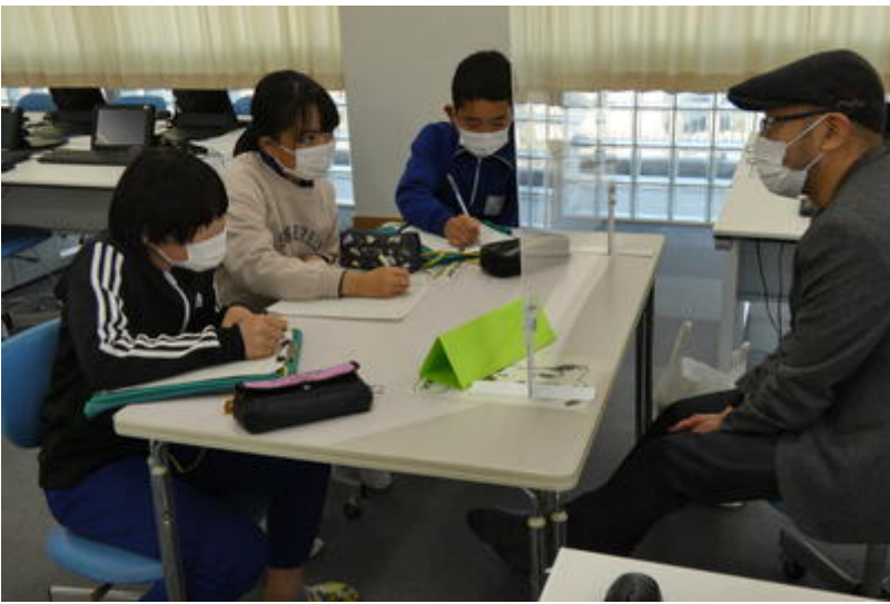
芳賀赤十字病院 様