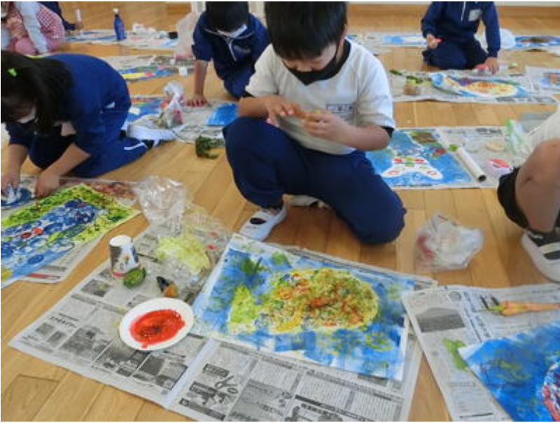
ステキなクラゲ。洗濯ばさみの面白い形を活かして、熱心に色を付けていました。