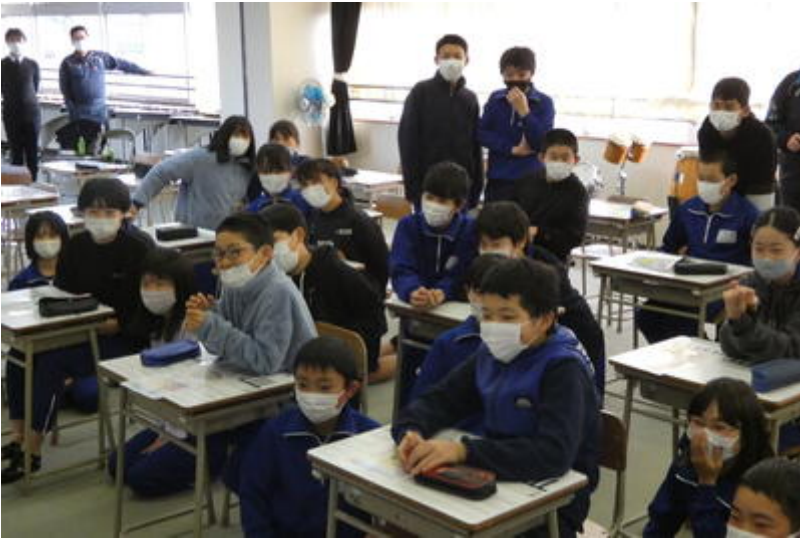
真剣な表情の6年生。