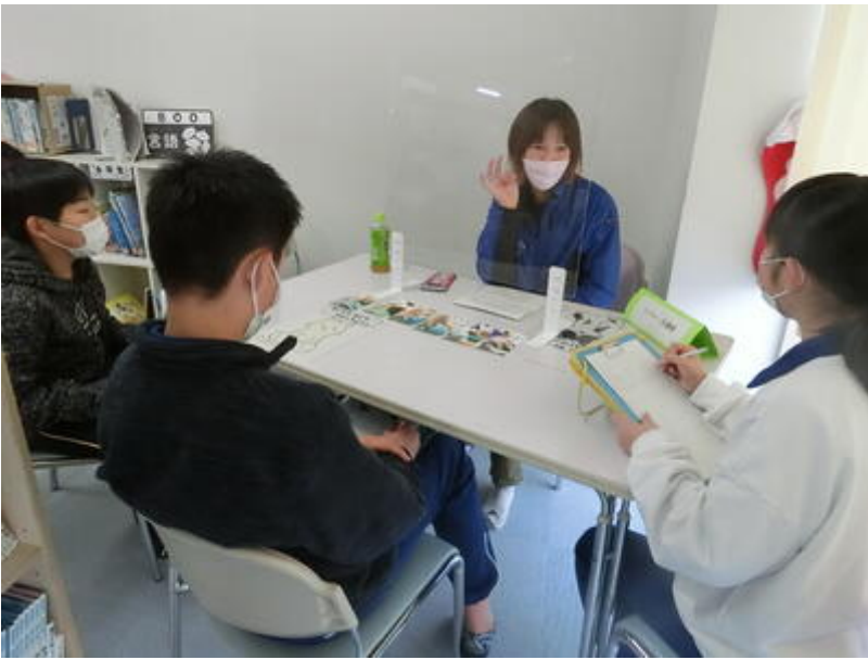
認定こども園 真岡ふたば幼稚園 様