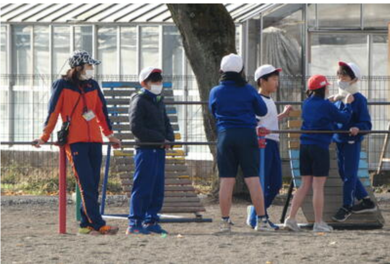
じーっと、みんなで何を見ているのか、とても気になります。