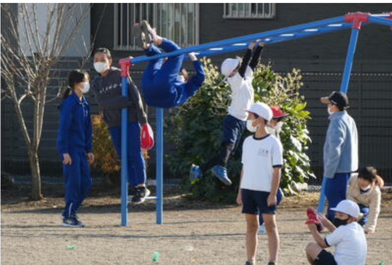
逃走中。 果たして先生は逃げ切れたのでしょうか。