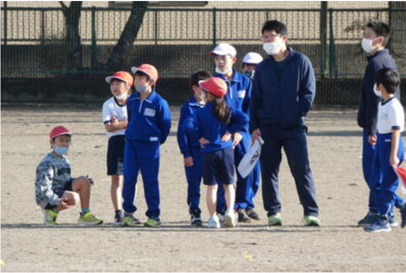
トレーニング中。10回×3セット！