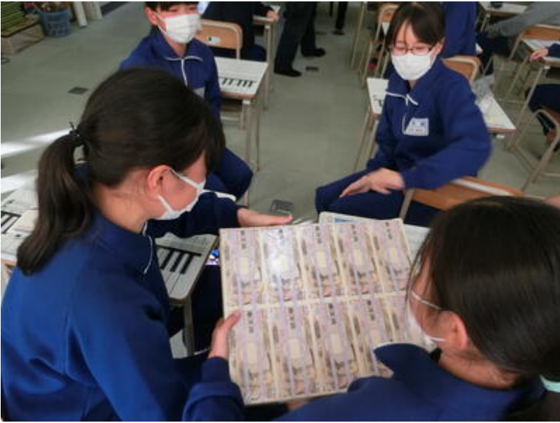
みんな興味津々です。