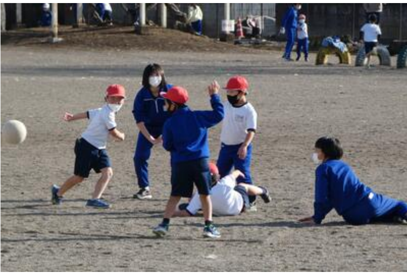
そこにジャンケン。何を決めているのでしょうか。