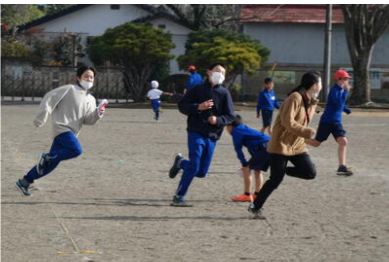
「先生、見ててください。」1年生が縄跳びを始めました。