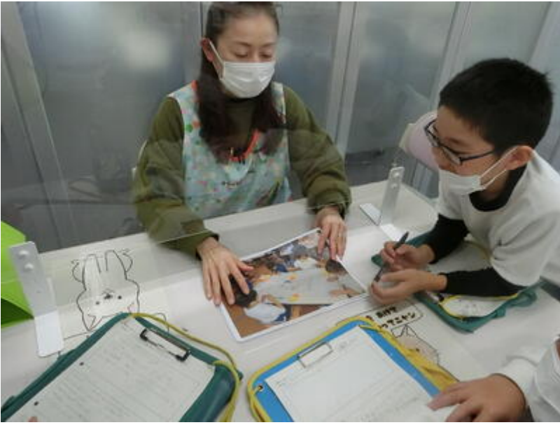
ホンダ女子ソフトボール部 ホンダリベルタ 様