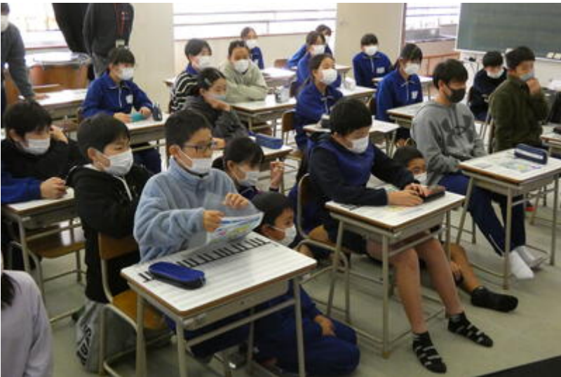
1億円分の紙幣と等しい重さを体感しました。