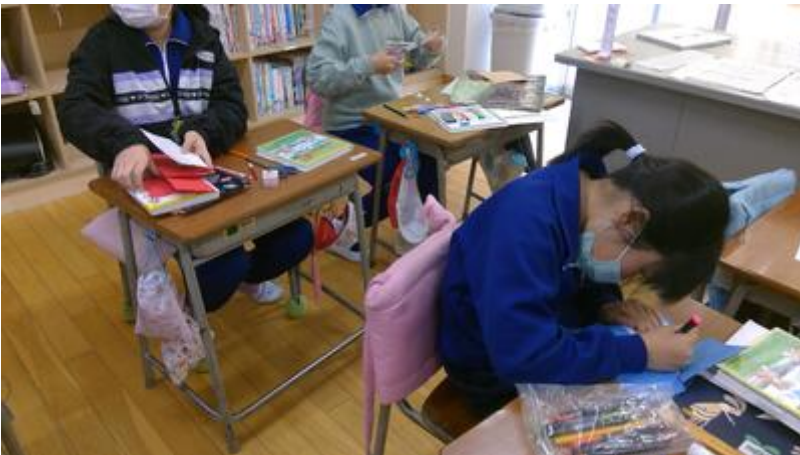
夢中で作業しています...！！