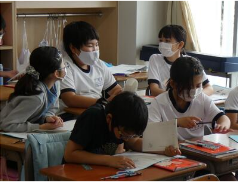
初めに子供一人一人が自分で考え、それをもとにグループごとに意見を出し合いました。