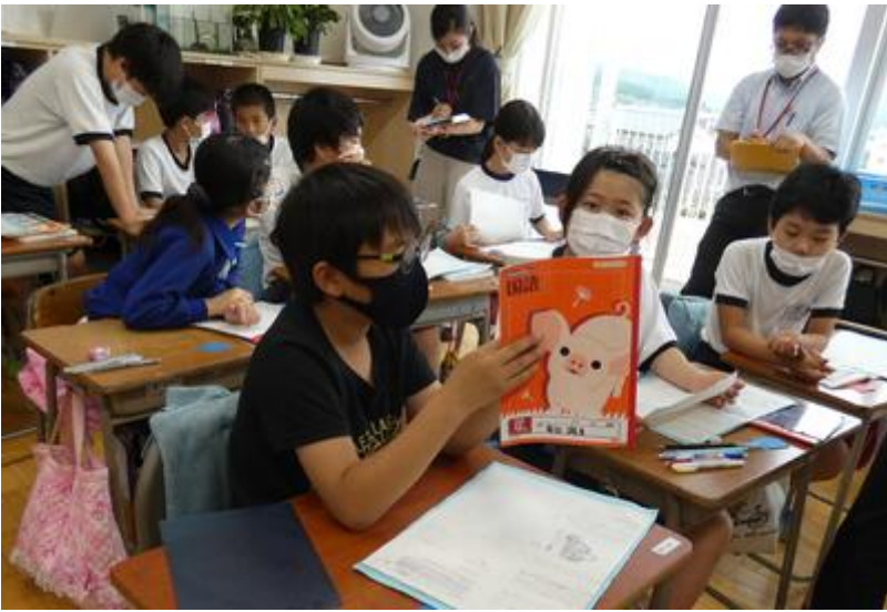
学習の振り返りにタブレットパソコンを活用しました。