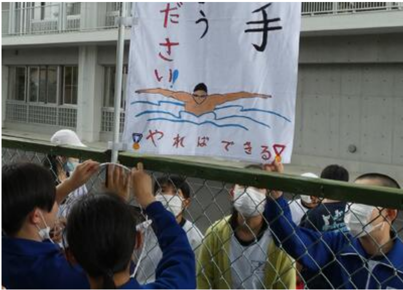
水沼選手、ガンバレー！！