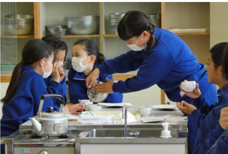
おかわりする児童も結構いました。みんなお茶が好きなようです。