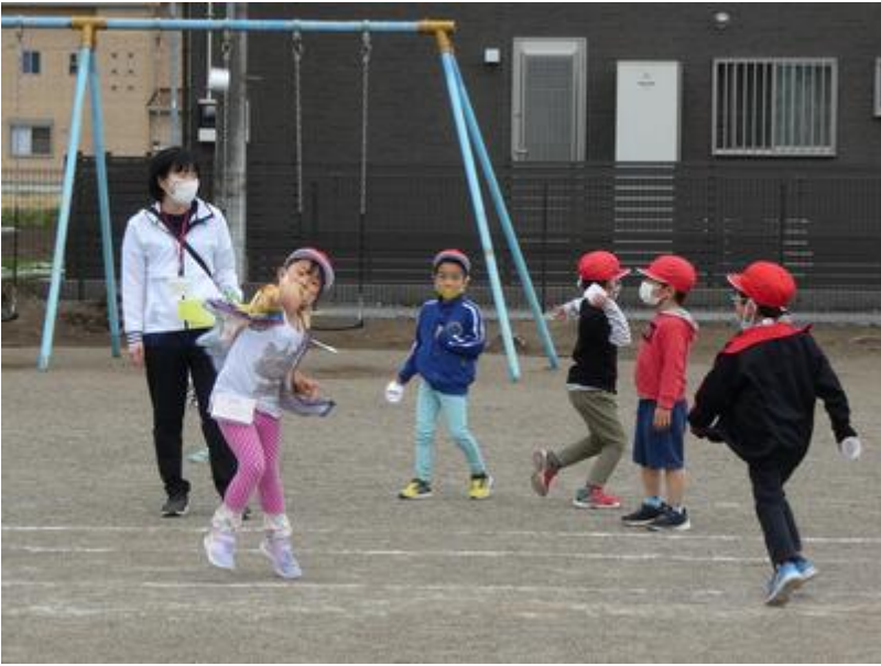
なかなかいい感じです。