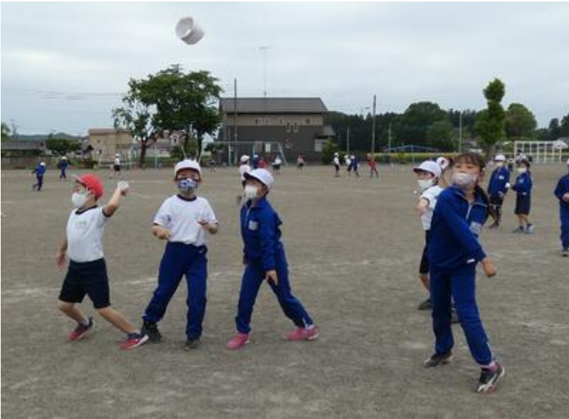
見よ！ダイナミックなフォーム！